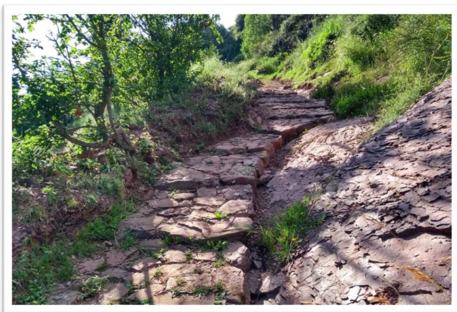
Imatge d'un antic camí empedrat de la Vall de Siarb.

Així doncs, l'objecte d'estudi d'aquest treball ha girat entorn la documentació i recuperació dels antics camins dels municipis que comprenien l'antic vescomtat de Vilamur, regit majoritàriament per la vall de Siarb (Pallars Sobirà), en un marc cronològic que transcorre des del segle XVI fins el segle XIX. Un treball que no hagués sigut possible sense l'ajuda de Museu de Camins, un projecte que revifa i manté viva l'essència històrica de la vall de Siarb, tot contribuint a posar en valor el patrimoni cultural i natural de la vall a través de la divulgació, el manteniment i la recuperació dels camins, senders i estructures tradicionals d'una manera comunitària i participativa.