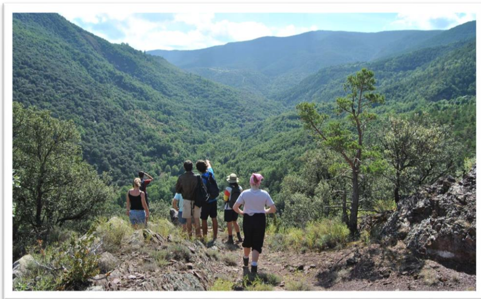
Imatge de la Vall de Siarb.

En aquesta recerca s'ha pretès realitzar un marge comparatiu entorn els camins, delimitacions territorials i carreteres que dibuixen el mapa actual del territori gràcies les referències passades que s'han pogut rescatar. A partir de la selecció d'una sèrie de fonts escrites i cartogràfiques primàries i secundàries que ens han permès conèixer el tipus de jurisdicció senyorial que hi dominava, els censos i cadastres dels diferents nuclis poblacionals, els conflictes agraris i pagesos o el paisatge modern i les seves transformacions, hem pogut vertebrar en quatre els àmbits temàtics o casos d'estudi: camins que recorren els actuals despoblats de Vilamflor, Burg i Pernui, els límits i diputes territorials entre Castellbó i Vilamur (en especial atenció a l'ermita de Sant Joan de l'Erm com a espai central de disputa), els marges, senders o corriols que recorren les terres i termes comunals del municipi i per últim, per tal d'assolir una perspectiva més global de la zona, els recorreguts comercials transpirinencs i locals que travessaren antigament l'àrea de Vilamur, en especial el comerç del tèxtil, el ferro, la sal, la fusta o la ramaderia transhumant. En tots els casos, considerant el context sociopolític de cada moment redescobrim els camins que han perviscut actius d'ençà.