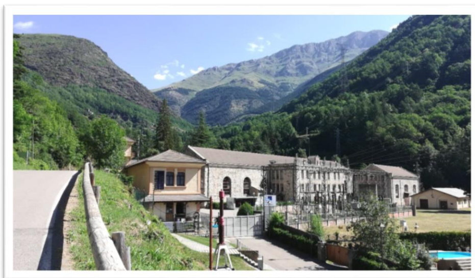
Imatge del Museu Hidroelèctric i la central de Capdella..

El Pirineu català ha esdevingut una de les zones on el fenomen turístic té un major impacte social i econòmic de Catalunya, convertint-se aquesta activitat en el principal motor econòmic de molts municipis de muntanya. Aquest Treball de Final de Màster pretén exemplificar una opció de desenvolupament econòmic i turístic sostenible i respectuós tant amb el medi ambient de la zona, així com amb els agents presents en el territori, l'administració i la població de la vall. Té alhora, l'ambició de contribuir a l'equilibri territorial i al desenvolupament de l'activitat turística a la comarca del Pallars Jussà, incidint en el desenvolupament de les àrees de muntanya i promovent el seu impuls econòmic i demogràfic.