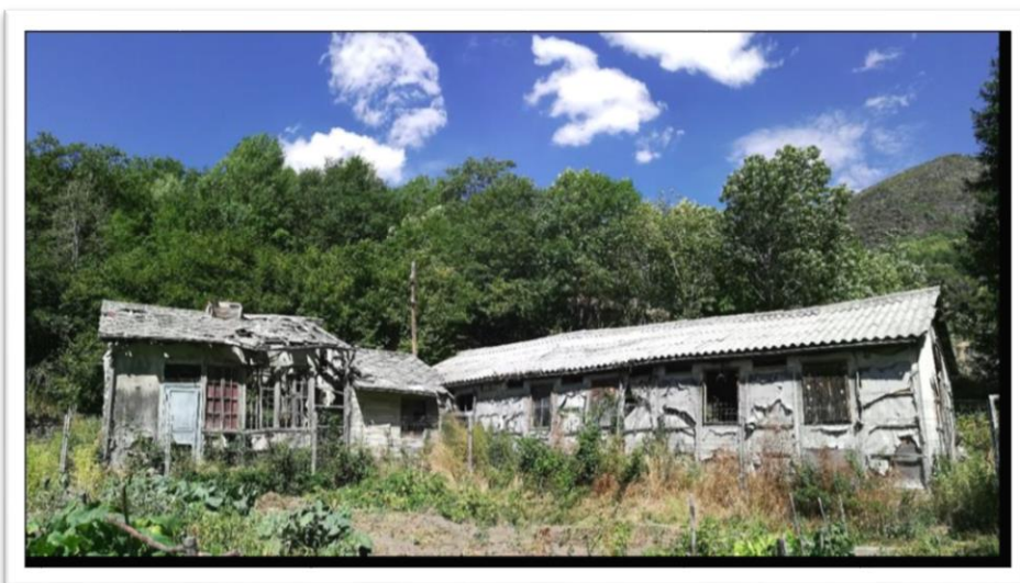
Imatge de l'estat de l'Hospital de Cartró abans de les obres de restauració de l'edifici.

En aquest indret del territori català, la recuperació patrimonial d'elements històrics i culturals, que ha guanyat terreny en els últims anys al conjunt del país, no n'ha quedat al marge, ja que gràcies a la història que té a les esquenes, compta amb un ampli nombre d'elements per patrimonialitzar, podent ser emprats com a recursos turístics. Amb tot això, el treball enceta el primer procés de participació ciutadana per donar veu als habitants de la vall per decidir el futur d'un edifici únic a Europa, l'Hospital de Cartró, que després de més de 100 anys de la seva construcció encara es manté en peu. Els estudis que s'estan fent de l'edifici indiquen que es tracta d'un cas singular, que té importància històrica no només pel que va significar en la construcció de la Central de Capdella, sinó també per la història associada a l'empresa constructora.